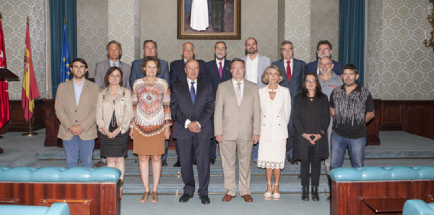
Consejeros del Consejo Social, 19 de septiembre de 2016