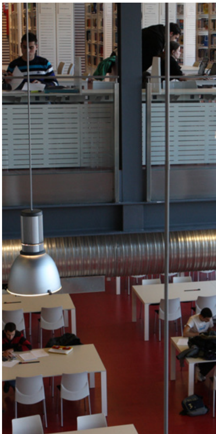
Biblioteca Campus Sur