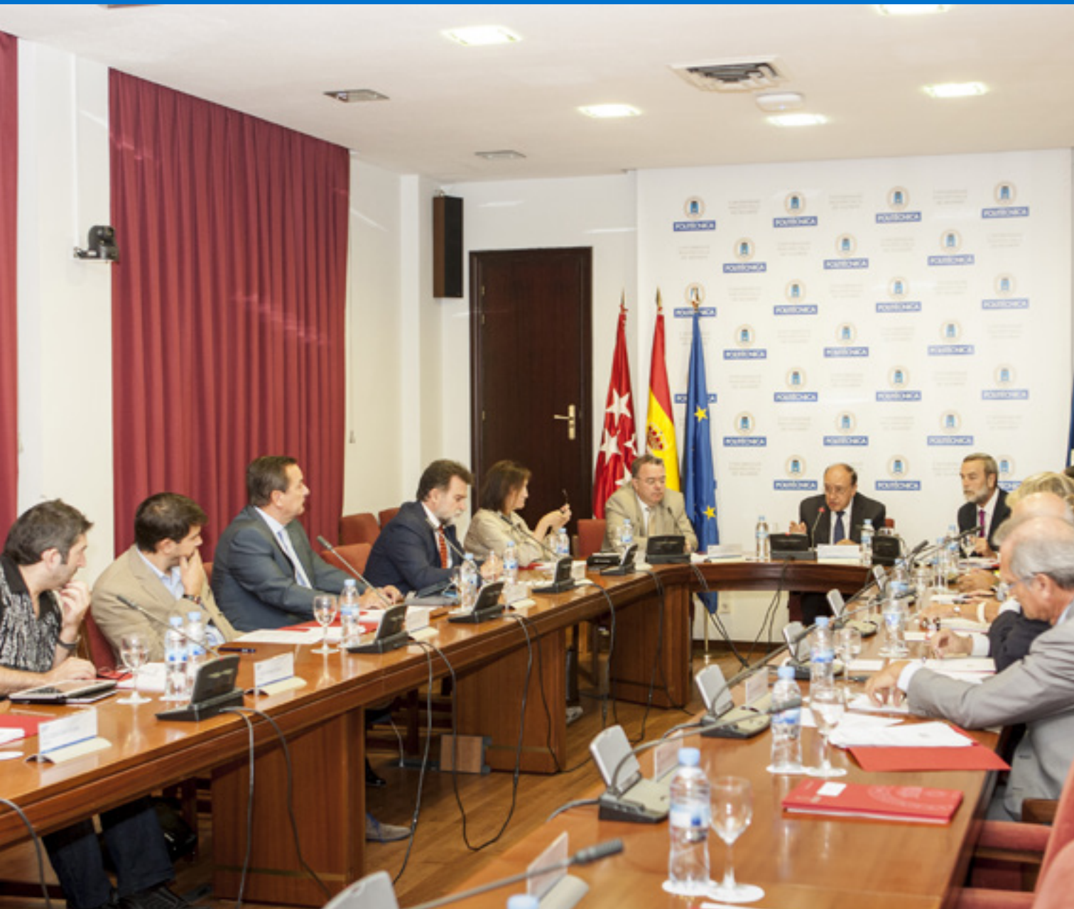
Sesión Pleno Consejo Social, 19 de septiembre de 2016